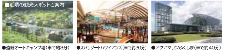
● 遠野オートキャンプ場(車で約3分) ● ソラリゾートハワイアンス(車で約20分) ● アクアマリンふくしま(車で約40分)